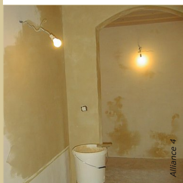
La teinte du badigeon s'éclaircit d'environ 50 % au séchage.

Nettoyer les outils à l'eau puis au savon noir. Le badigeon se conserve une semaine au frais, dans un seau avec couvercle. Bien brasser avant réutilisation et ajouter de l'eau si nécessaire.