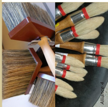
Les outils : brosse à badigeon rectangulaire avec des soies souple et une brosse à réchampir pour peindre les bordures.