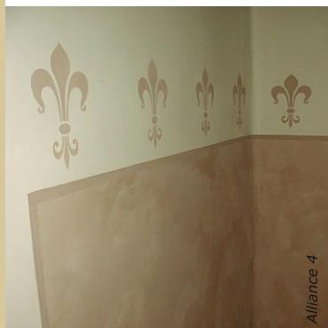
Avec le badigeon, la créativité n'a pas de limite : frises, pochoirs, décors ...