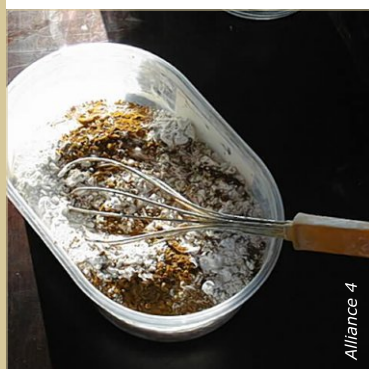
Mélanger les ingrédients secs. Noter précisément le dosage en pigments afin de pouvoir le reproduire.