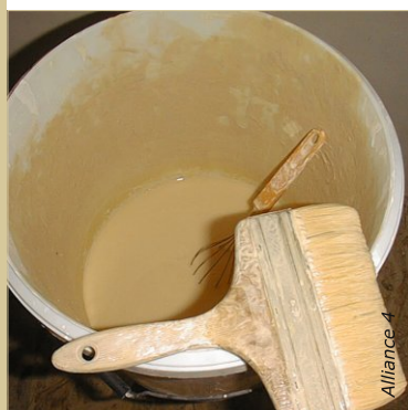
La consistance est très fluide et à tendance à se sédimenter. Brasser souvent au cours de l'application.

Le badigeon à la chaux est la peinture la plus répandue dans le monde et sans aucun doute la plus économique.