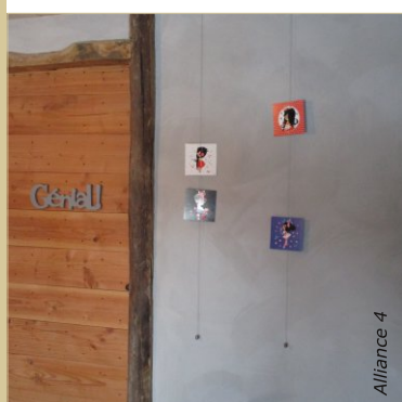
Le badigeon est naturellement nuagé. Ici il a été appliqué sur une cloison en lattis recouverte d'un enduit à l'argile, en 3 couches.

VOUS TROUVEREZ CHEZ ALLIANCE 4 TOUTS LES PRODUITS POUR LA RÉALISATION DE VOTRE BADIGEON AINSI QUE POUR LES ENDUITS À L'ARGILE ET A LA CHAUX. CONSULTEZ LE CATALOGUE EN LIGNE SUR WWW.ALLIANCE4.FR